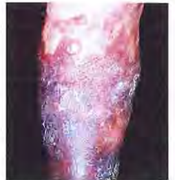
Sideroesclerosis y eczema en un hombre. Complicación de unas varices nunca tratadas. Profesión: hostelería.