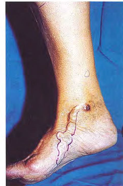
Úlcera en tobillo por reflujo de una variz en la planta del pie.