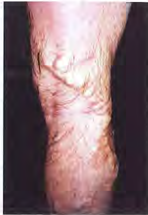
Tipica variz del hombre. Cara posterior de la extremidad.

Con este planteamiento resulta que el varón es el gran olvidado de esta problemática. En este tema el tabú persiste todavía y, por supuesto, la Administración Sanitaria no ha hecho nada por cambiar esta actitud negativa.