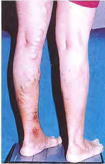
Lesión trófica en el tobillo izquierdo por reflujo de varices tronculares de la vena safena interna.

8. Trombosis. Lo más grave es la formación de un coágulo en el interior de una variz desarrollándose la enfermedad tromboembólica.