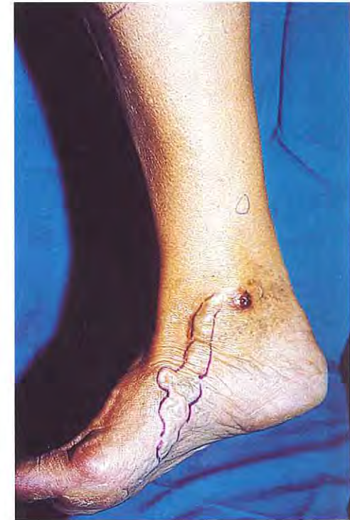
Úlcera en tobillo por reflujo de una variz en la planta del pie.