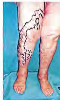
Enormes varices en una mujer.

- No a los tacones planos, cuando la bóveda plantar sea plana.