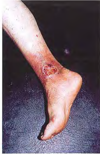
Típica úlcera varicosa. Siempre está situada en la cara interna del tobillo y a su alrededor hay una pigmentación ocre.